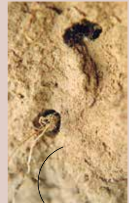
Tarwewortels groeien in een wormgang