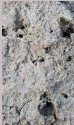
Wormgangen en poriën op 50 cm diepte