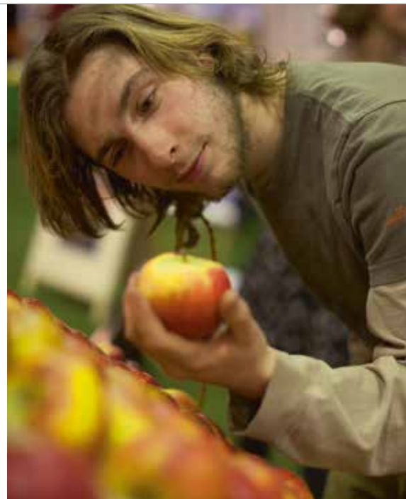
Op het BD/Demeter-plein in 2013

Naast de demonstraties is er ruimte voor uitwisseling en vragen aan de organisaties over opleidingen, cursussen, intervisie, collegiale toetsing, omschakelen en gebruik van promotiematerialen in winkels. Bezoekers aan het plein kunnen meedoen aan een prijsvraag waarbij totaal tien Demeter pakketten worden weggegeven. Naast de activiteiten op het BD/Demeterplein zijn er op de BioVak verschillende workshops over 'Doorschakelen naar Demeter' en over bedrijfsindividualiteit en bedrijfsopvolging. ☺