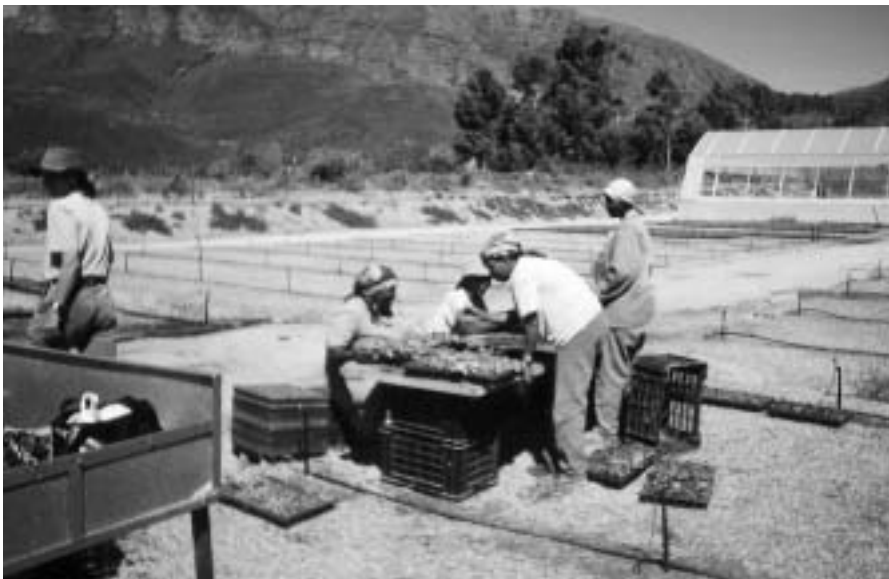
Sorteren van plantgoed op bd-bedrijf.