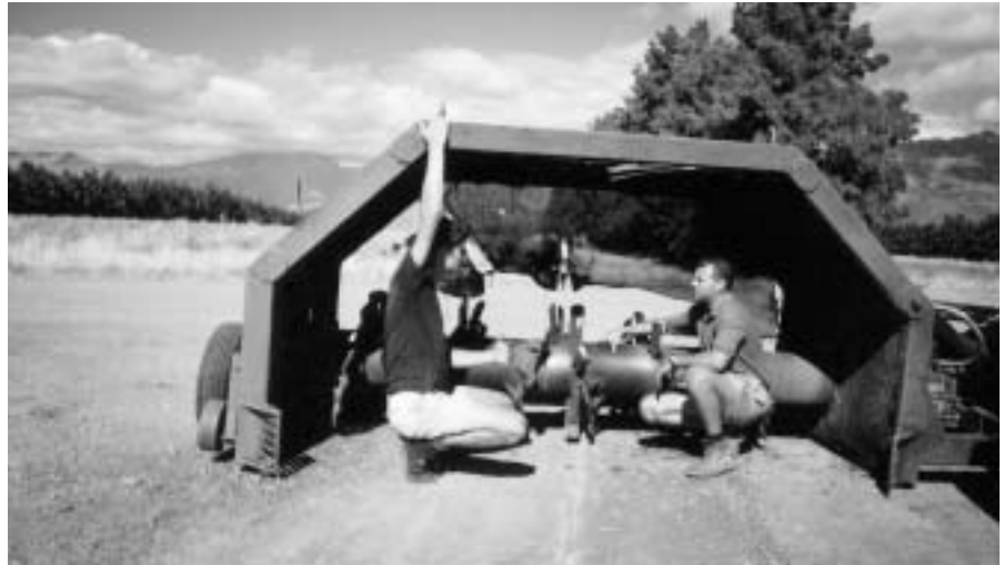
Compostkeerder op biologisch tafeldruiven bedrijf.

Ondertussen is, net als in de andere zuidelijk Afrikaanse landen, AIDS een steeds groter probleem omdat het vooral de jonge, werkende mensen aantast. Ouderen en kinderen waren al afhankelijk van wat zij aan inkomen binnenbrachten, dus de noodzaak voor een alternatieve bron van voedsel en inkomen in de vorm van low input tuintjes zowel in de krottenwijken als in de voormalige thuislanden wordt steeds groter. Ook om de lage werkgelegenheid het hoofd te