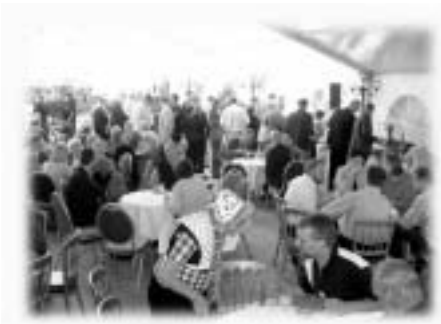
Door het wat late tijdstip werd de boerenlunch extra gewaardeerd.