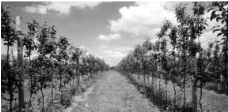
...en moderne aanplant

structuur en bodemleven niet op orde zijn. Compost helpt de grond evenwicht te hervinden.”