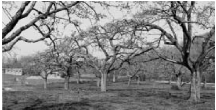
Hoogstam- fruitbomen bij Vandewall.....

wijze van discussiëren tussen preciezen en rekkelijken. Een moderne inquisitie, met als effecten, uitstoting van andersdenkende rekkelijken en in eigen gelijk wentelende preciezen. Kenmerkend voor sekten.”