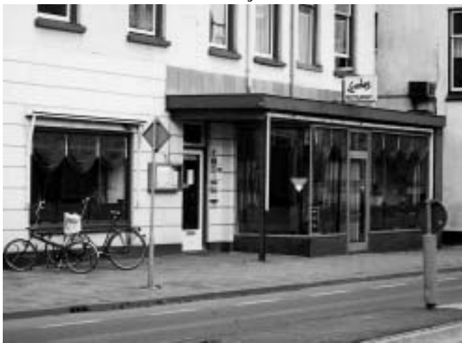
Restaurant Lembas aan de Hoofdstraat in Driebergen.

scheiden, voor vlees en vis hebben wij speciale pannen en werkplekken. In tegenstelling tot vroeger, toen de pannen op het vuur stonden waaruit we opschepten, wordt nu alles zoveel mogelijk à la minute en vers bereid.